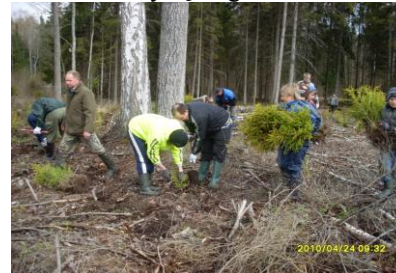
Tradicinės kasmetinės miško sodinimo tarnos metu (2010-04-24)

Galiu pasidžiaugti miško želdiniais ir išugdytais medynais. Kasmet pasodiname apie 35 hektarų miško. Dalis miško atsinodinama, o dalis sodinama tose vietose, kur jis anksčiau neaugo. Jau tapo tradicija kiekvieną pavasarį su Šimkaičių bendruomene pasodinti, įveisti naujo miško apie 1 ha. O medynų išugdome 100 hektarų.