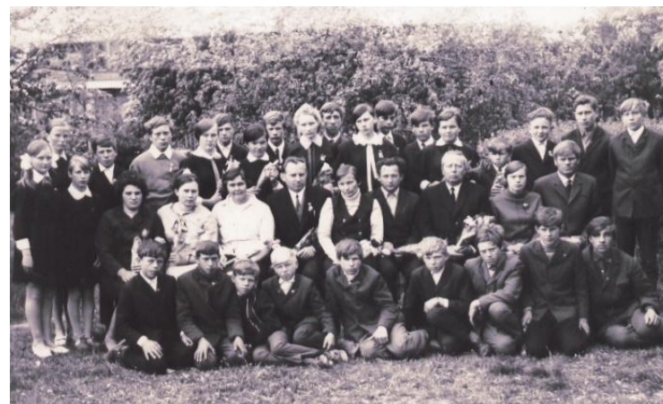
Nuotraukoje iš praeities: 1971 m. Šimkaičių mokytojai ir mokiniai

O klasėje atrodys taip, kaip būvę Senų suolų eilė, juoda lenta. Ir sakinyš lyg užrašytas vakar Su ta pačia gramatine khlaida.