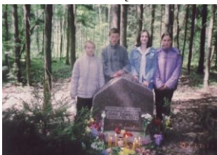
Jaunieji mokyklos kraštyrininkai prie paminklo

Žalia gamta pravirko – Rūduo čionai atkūdo... Lankyt, broliai, kapa Ir ginkyt laisvę didžią. (Iš Vakarų Lietuvos partizanų kūrybos)