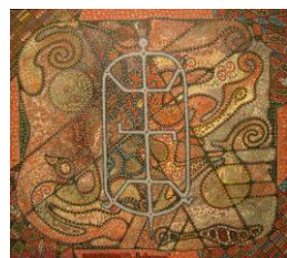
Keletas Beno Fanšteino tapybos darbų